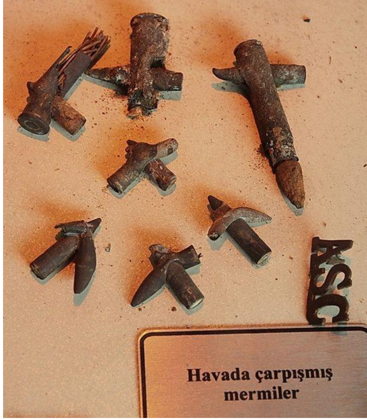
Muzej bitke Canakkale 1915. TIR Müzesi